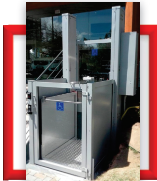
Plataforma de acessibilidade