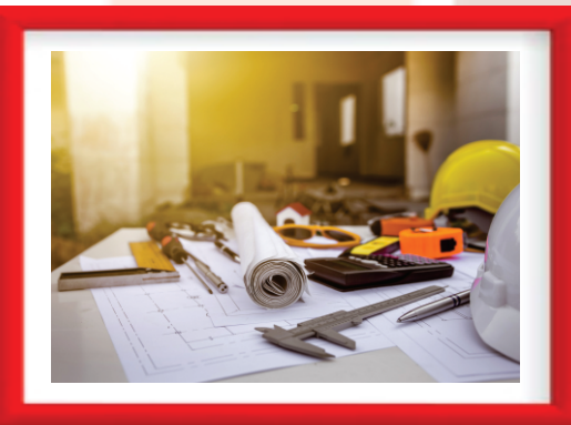
Desenvolvimento de novos produtos