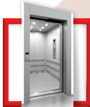
Elevador de carga