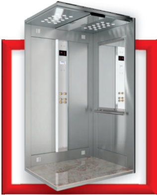
Elevador residencial e predial para passageiros

Confira nossos produtos e escolha a melhor opção para sua necessidade!