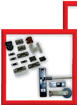
Peças para reposição